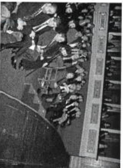
Ιστορία Κυπριακής Διαλέκτου